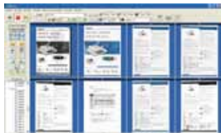
Pantalla principal de AVScan X

-La herramienta inteligente de manejo de documentos